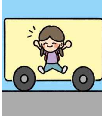
버스 안에서 장난치거나 돌아다니지 않아요.