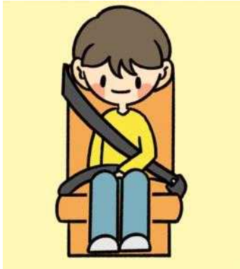
출발 전 안전띠를 착용해요.