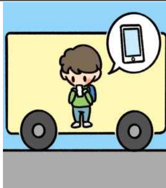
(대중교통)버스에 서 있을 때 휴대폰을 사용하지 않아요.