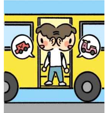
좌우를 살펴보고 다른 차량이나 오토바이가 없는 것을 확인하고 내려요.